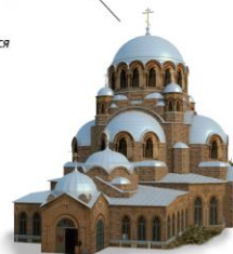
Собор Богоматери «Всех скорбящих Радость»

1957 г. Остров В результате наполнения Куйбышевского водохранилища оказался на острове.